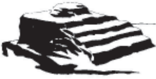
Fig. 8. Lugar alto

otra parte, Josafat no destruyó los lugares altos y casó a su hijo con Atalía, una hija (o hermana?) del Rey Ajab de Israel y la Reina Jezabel (2 Re 8.18,26). Dada la devoción de Jezabel a Baal (1 Re 18.19), el contrato de matrimonio seguramente contenía provisiones para la adoración de Baal por parte de Atalía en Jerusalén. El hecho de que Reyes no mencione esta circunstancia, y su valoración de Josafat como un “rey bueno”, es evidencia del significado limitado de la alabanza editorial que se le otorga.