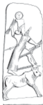
Fig. 3. Baal guerrea contra enemigos