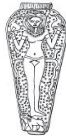
Fig 4. Figura de diosa

Estos reclamos no deben ser ignorados como mera exageración; la evidencia arqueológica los apoya. Entre los objetos más comunes encontrados en las excavaciones de las ciudades israelitas están las figuras de mujeres desnudas; la mayoría de ellas son representaciones de algún poder divino concebido como una diosa. Este significado es particularmente claro para las figuras encontradas en santuarios junto a otros objetos cúlticos, como en los santuarios del período israelita en Deir 'Alla y Tanek. Nombres compuestos con Baal son comunes en los óstraca del siglo VIII de Samaria. También son comunes los sellos en los que nombres hebreos, y en algunos casos yahvistas, están combinados con figuras de dioses. Algunas de las figuras pueden ser representaciones de Yahvé, 10 pero otras representan el dios sol o luna, o la Reina