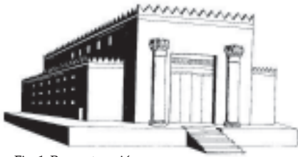
Fig. 1. Reconstrucción del templo de Salomón

cananeo de la copulación como una ceremonia religiosa (un rito de fertilidad popular) se estableció en los lugares de culto principales de Yahvé, incluyendo el templo de Jerusalén.