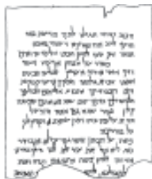
Fig 12. Reproducción de manuscrito de Qumram

Con esta aparición de los principios de la sinagoga – un tipo de culto muy distinto al culto sacrificial de los templos – el partido sólo-Yahvé se convirtió en efecto en una nueva religión, en un nuevo tipo de religión. De los Israelitas había emergido aquél pueblo peculiar que se llamaba a sí mismo Israel y que más tarde serían llamados los judíos. Un pueblo de muchos grupos sociales y afiliaciones políticas diferentes, enlazados por acuerdos en asuntos menores, pero unidos fundamentalmente en su compromiso a adorar solamente a Yahvé, unidos en su rechazo de otros dioses (un rechazo que pronto se expresó como la negación de su existencia), unidos por la consiguiente alienación de todos los demás pueblos (y por la hostilidad que esto produjo), unidos por su convicción del amor y el celo de Yahvé, unidos en su segregación auto-impuesta, unidos por su tradición legendaria e histórica (concebida como una serie de ejemplos del amor y el castigo de Yahvé), y unidos por sus costumbres peculiares y por su ley. Una ley concebida como una declaración de la voluntad de Yahvé, como los términos de un pacto con Yahvé que Israel estaba obligado a cumplir: como las reglas de una disciplina por medio de la cual Israel es purificado para su amor, como las reglas de una vida que manifiesta y celebra su amor, y como el elemento central de una tradición literaria y oral que cada generación debe aprender y enseñar. 59