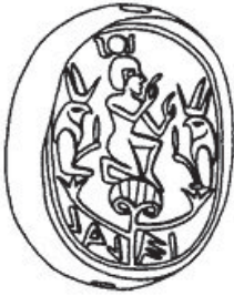
Fig 5. Sello con nombre hebreo y figura del dios sol