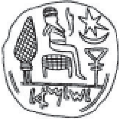
Fig. 9. Sello con dios luna

los relatos de Reyes. 28 Pero la luna y el sol habían sido adorados durante largo tiempo en Palestina, y la popularidad de los planetas y las huestes celestiales podría ser producto de la influencia de Babilonia más que de Asiria.