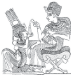
Fig. 11. Imagen egipcia. Intimidad entre el rey y la reina.

Teológicamente, esta confusión de Oseas derivó en dos consecuencias, expresión cada una de ellas de una profunda ambivalencia. Por un lado, Yahvé como esposo ama a Israel, quien a su vez debe amarlo (Os 2.21; 3.1). Por otro lado, Israel es infiel y el amor de Yahvé se convierte entonces en odio y se expresa en castigo (Os 2.4-15). La conjunción de estos dos temas le da al libro de Oseas – y a mucha de la literatura profética tardía – su peculiar poder y fuerza retórica. Las repentinas alternancias entre amor y odio, las metáforas sexuales y su violencia (“Y ahora descubriré su vergüenza a los ojos de sus amantes..”) (Os 2.12) - es el lenguaje de la pasión obsesiva que ha impulsado al profeta a expresar con extraordinaria intensidad la combinación de amor y odio, la necesidad de ser amado y castigado, la voluntad de amar y de destruir.