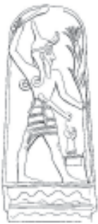
Fig. 10. Baal, dios de la tormenta y fertilidad