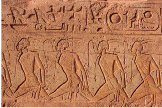
Esclavos nubios en un relieve egipcio de Abu Simbel

Una idea particular del pensamiento estoico sobre el tema de la esclavitud y la libertad, se convertirá en piedra angular del mensaje cristiano. Los estoicos consideraban “lo exterior” (a saber: la sociedad, la naturaleza, las pasiones), como una forma de opresión. Con ello, se desplazaba el sentido del término esclavo a un nuevo ámbito semántico: libre es la persona que se ha liberado interiormente de estas dimensiones opresivas del mundo exterior: “Nadie es libre si no es dueño de sí mismo” dirá Epicteto. Hablamos aquí, ya no de una libertad política, sino de una libertad “personal”, libertad para sí mismo .