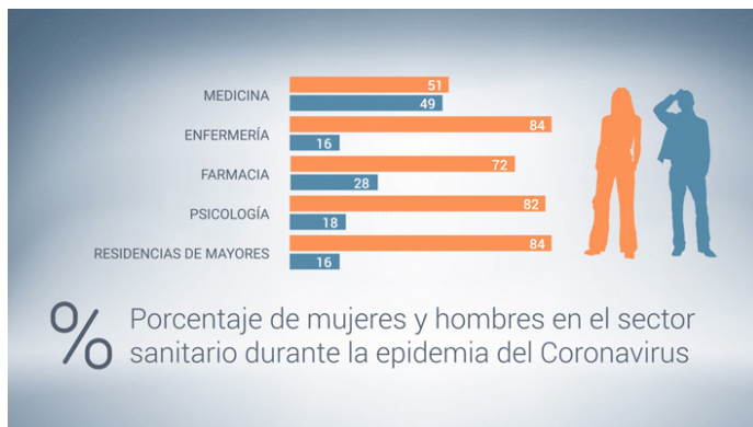
GRÁFICO 2: Distribución de funciones de hombres y mujeres en servicios de salud en el planeta